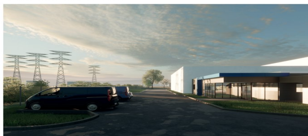
Perspective de l'accueil

Framatome — atelier ICPE — Paimbœuf (44)