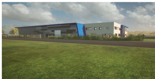
Perspective depuis rue