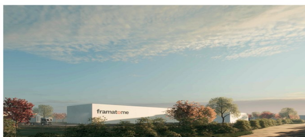
Perspective depuis le chemin cycliste

Codes Rousseau — siège social inauguré le 22 juin 2023 — Les Sables-d'Olonne (85)