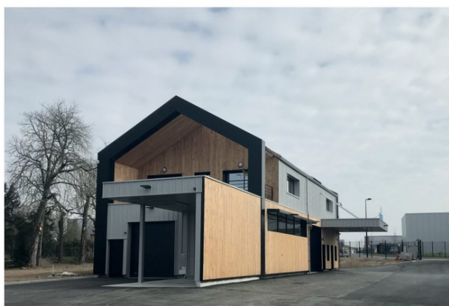
Façade sur parcelle